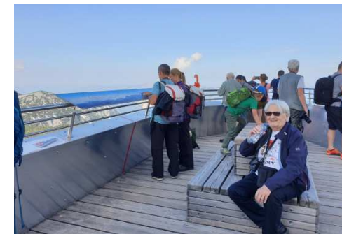
Dobytí vrcholu Krippensteinu

Asi nejzajímavější byl výlet na Krippenstein 2100m s vrcholovými cíly Pět prstů, kde byl překrásný výhled na jezero Hallstattsee. Kdo nechtěl šlapat až na Pět prstů, vylezl na vyhlídku Spirála, která je na nejvyšším místě Krippensteinu anebo na druhou stranu na Žraloka.