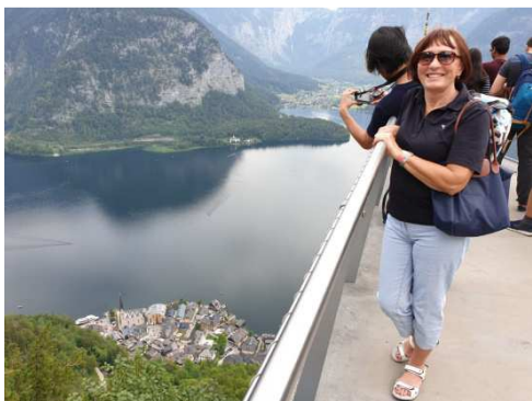
Pohled na Hallstatt od solných dolů