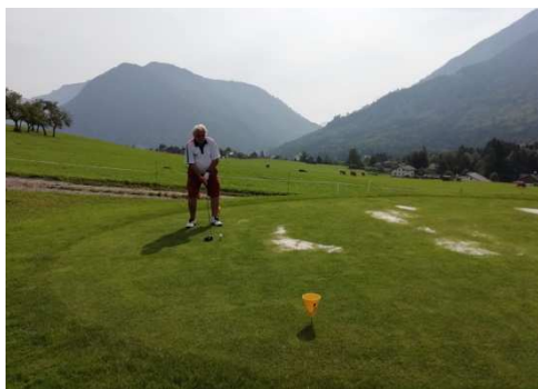
Golfové hřiště Bad Aussee

V Rakousku je spousta krásných golfových hřišť, tak i naši účastníci vyrazili na golf.