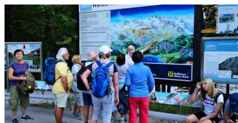
Plánování výletu na Krippenstein

Asi nejzajímavější byl výlet na Krippenstein 2100m s vrcholovými cíly Pět prstů, kde byl překrásný výhled na jezero Hallstattsee. Kdo nechtěl šlapat až na Pět prstů, vylezl na vyhlídku Spirála, která je na nejvyšším místě Krippensteinu anebo na druhou stranu na Žraloka.