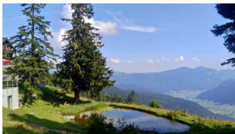
Vysoko nad Gosausee