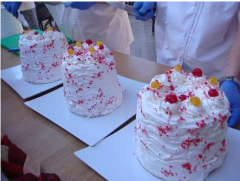
Dorty (nejen) pro vítěze

Měli jsme co dělat, abychom za týden obhlédli celý Duni resort, je rozlehlý a zahrnuje několik hotelů. Jako klienti pětihvězdičkového hotelu jsme měli přístup do celého resortu a všude také mohli čerpat all inclusive. Moře bylo chladnější – cca 21 stupňů – ale koupat se v něm dalo, bazény byly krásné, bylo jich hodně a měly příjemných 23 stupňů.