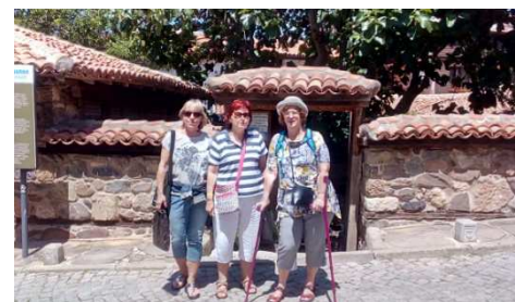
Výlet do Sozopolu