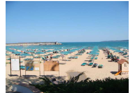
Pláž u hotelu – mělké moře v zálivu

výhled na moře a na bazény. První večer jsme si jen užívali skvělého pětihvězdičkového all inclusive a odpočívali po cestě, na bridž nedošlo.