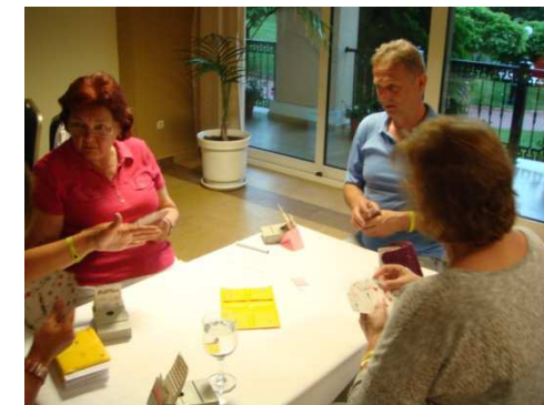
Hrací místnost s výhledem do zahrady a na moře